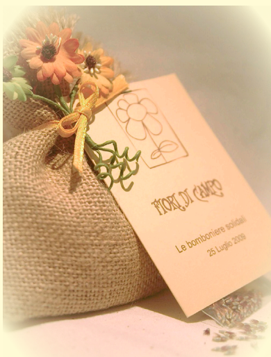
La bomboniera di Fiori di Campo, da cui spuntano i semi contenuti nel bigliettino

Per il vostro matrimonio, per la vostra comunione, cresima, laurea, per il battesimo dei vostri figli o per qualsiasi altra ricorrenza, abbiamo ideato qualcosa di veramente originale. Non la solita bomboniera, ma un simbolo di vita e di speranza racchiuso in una bustina di semi di piante spontanee.